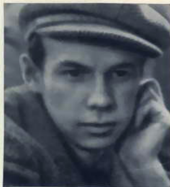
Рабочие одной смены