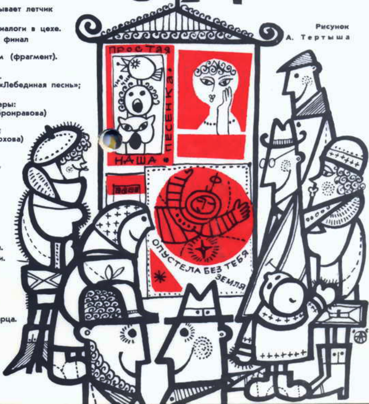
Рисунок А. Тertyша