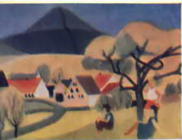
↑ Пейзаж Милан Геллер. ЧССР.