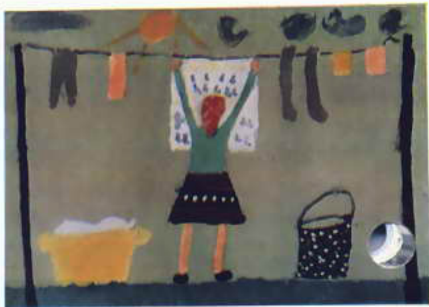
Мама вешает белье. Удо Эльмер. ГДР. ↑

Это рисунки международного конкурса «Моя страна — мой дом». Войдите и вы, читатели «Колобка», в эти дома, где живут ребята из разных стран.