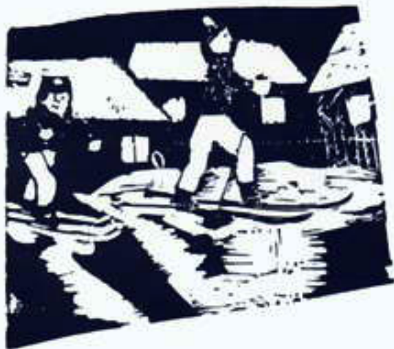
Зима. Ионекес Ромуальдос. СССР.

Утром я встаю, Песенку пою. Песенка простая, Вот какая: «Ля-ля-ля-ля-ля! Вот и песня вся». В лад со мною Чиж давно не спит, Он поет, свистит Песенку простую, Вот какую: «Чив-чив-чив- чив-чью. Вот как я пою!» Сели мы рядом, Спели мы втроем Песенку простую, Вот какую: «Мяу-чив-чив- ля-ля. Вот и песня вся!» Жмурится, поет кот Песенку простую, Вот такую: «Мяу-мяу-мяу- мурлык. Так я петь привык».