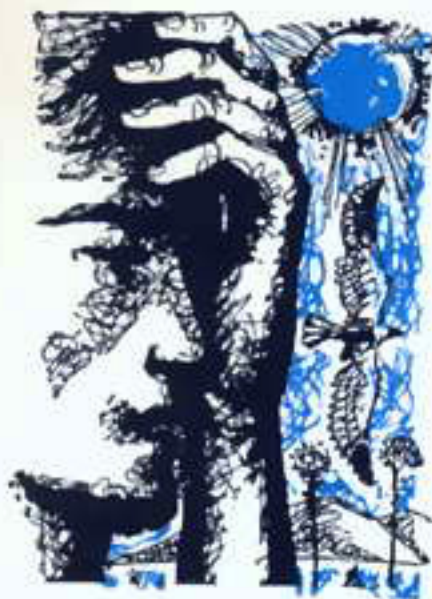
Рис. А. Брусиловского